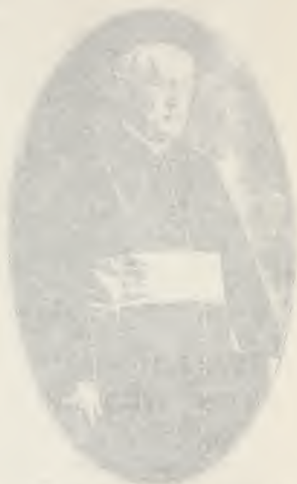
Portrait of a young boy, 1840. (The child is holding a book or tablet.)